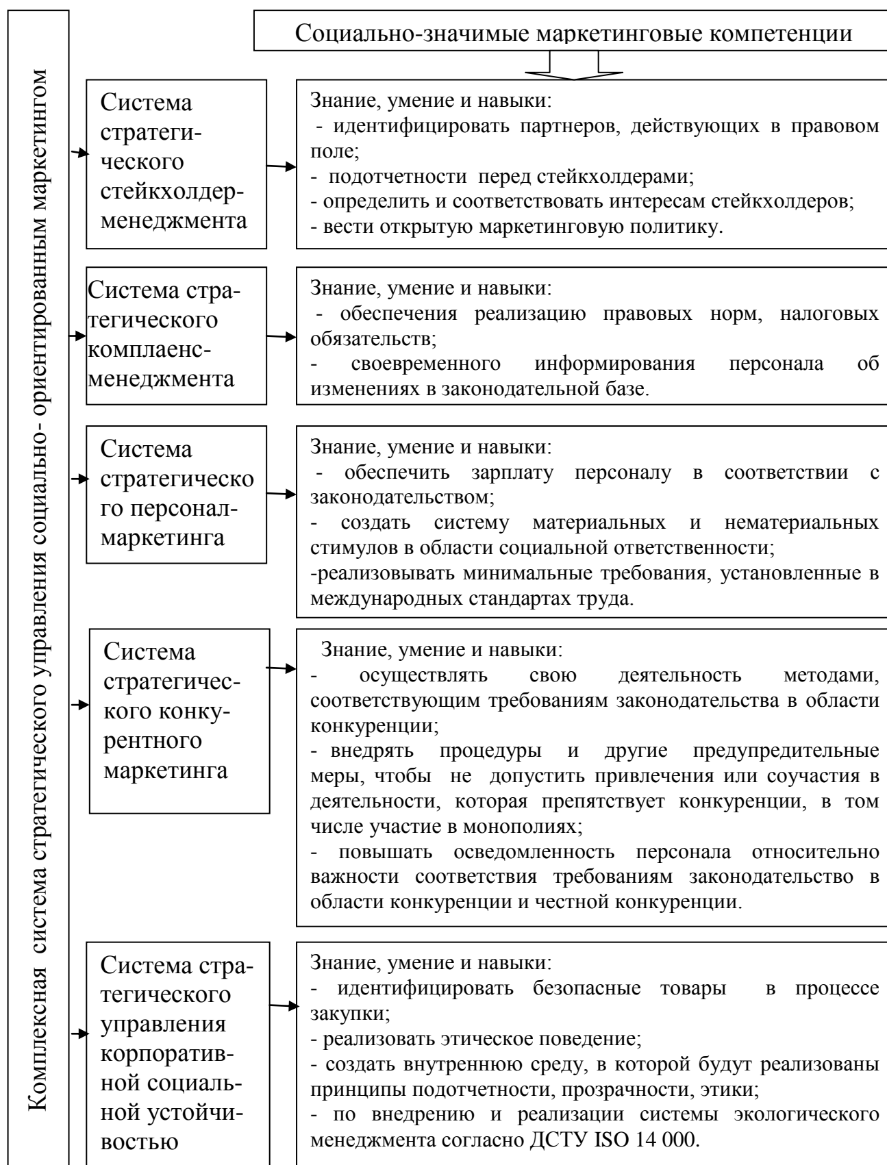
Рисунок 2. Социально-значимые маркетинговые компетенции в системе стратегического управления социально-ориентированным маркетингом